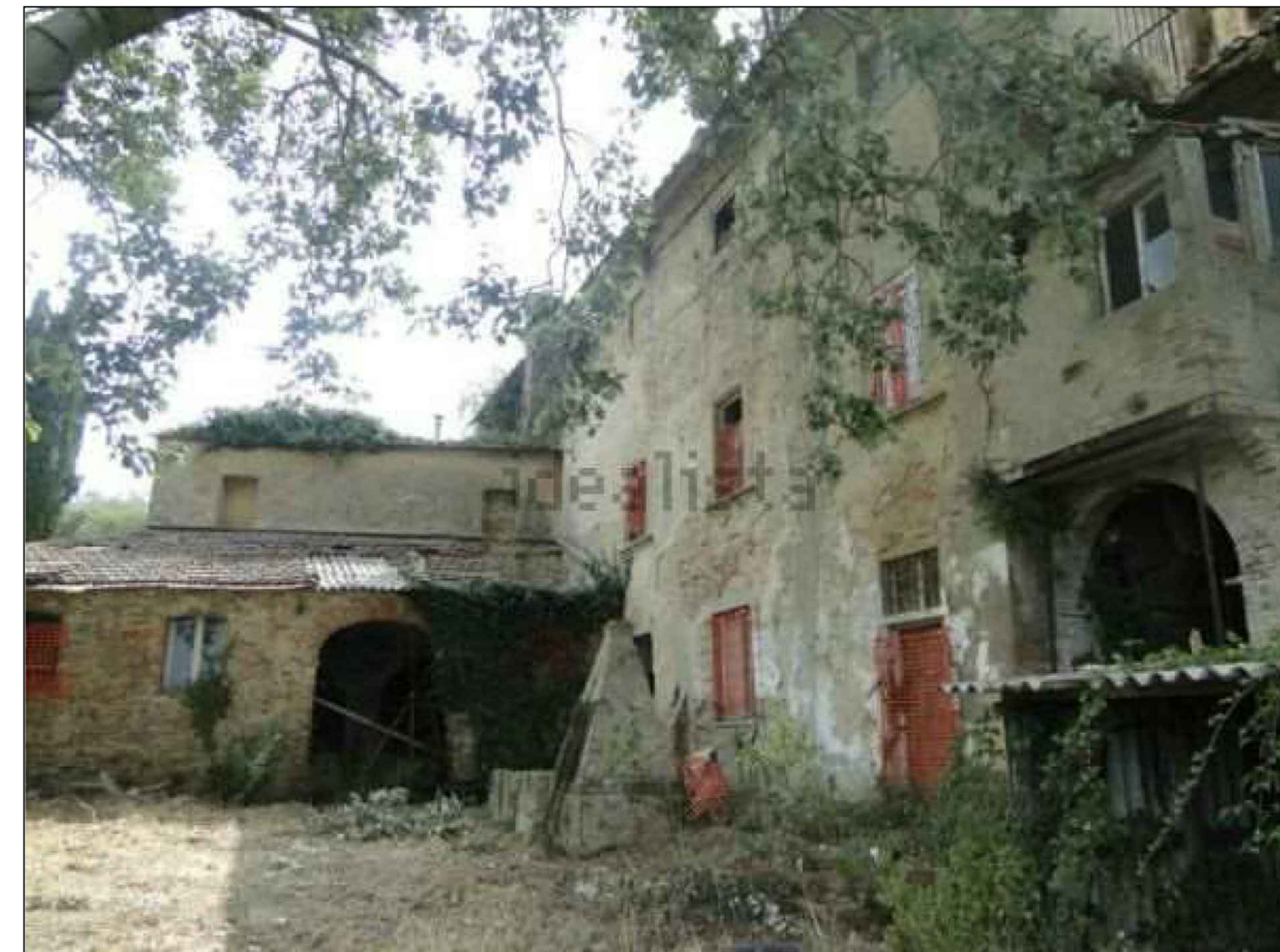
FOTO STATO ATTUALE