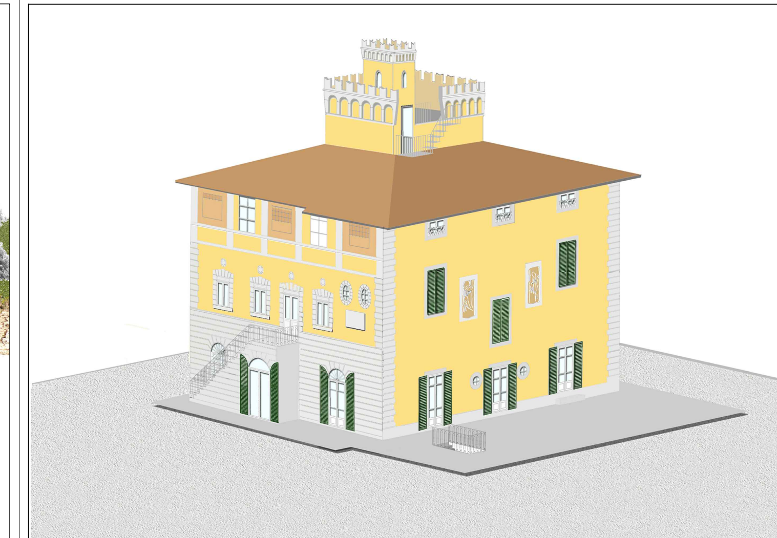
ASSONOMETRIA STATO ATTUALE