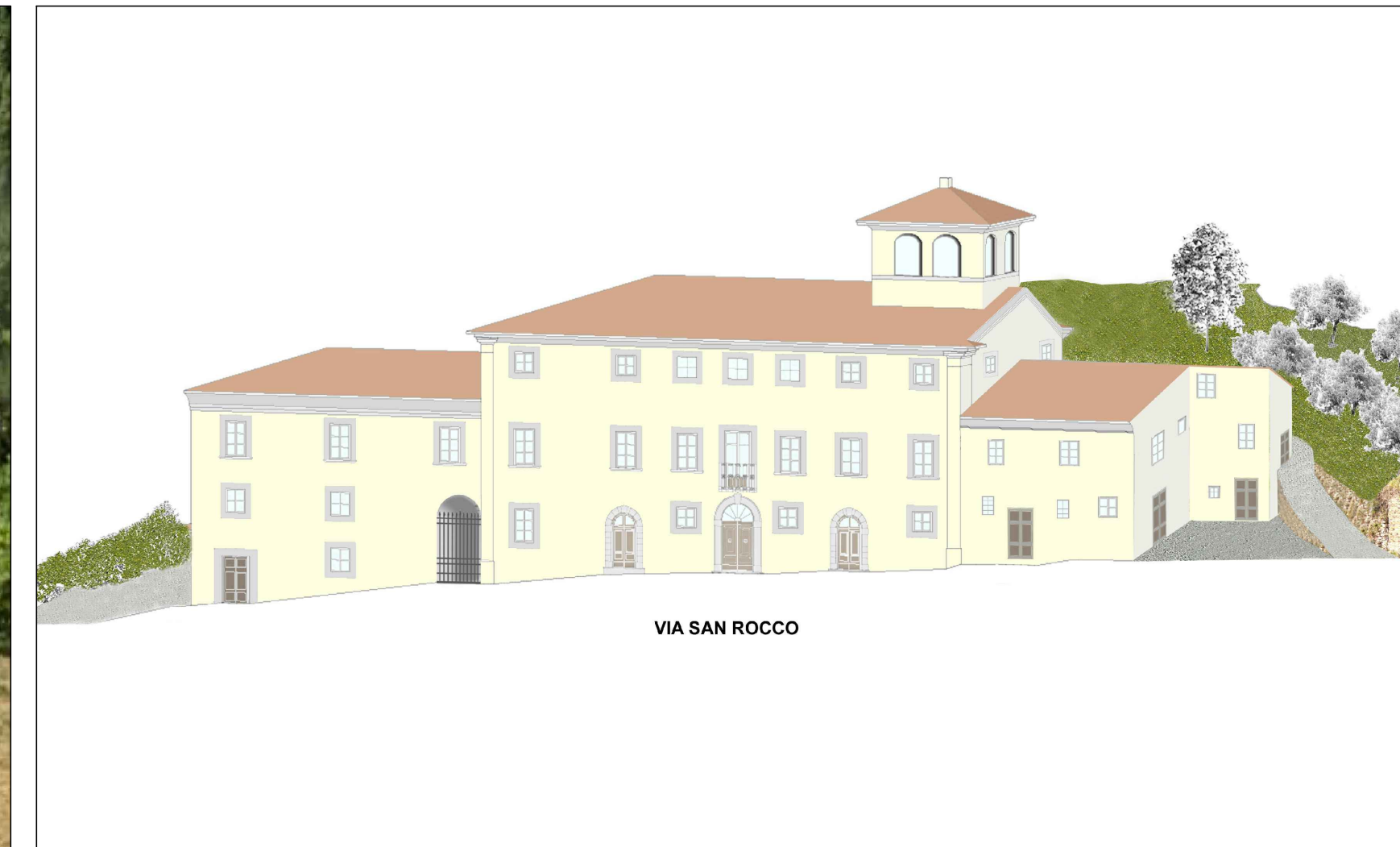
VIA SAN ROCCO