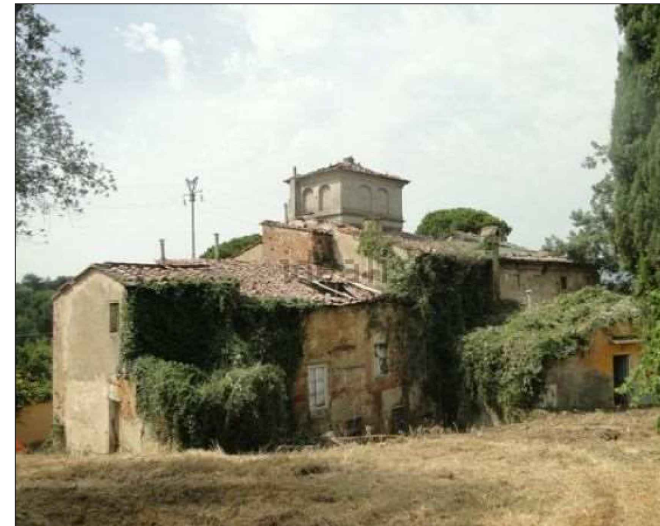
FOTO STATO ATTUALE