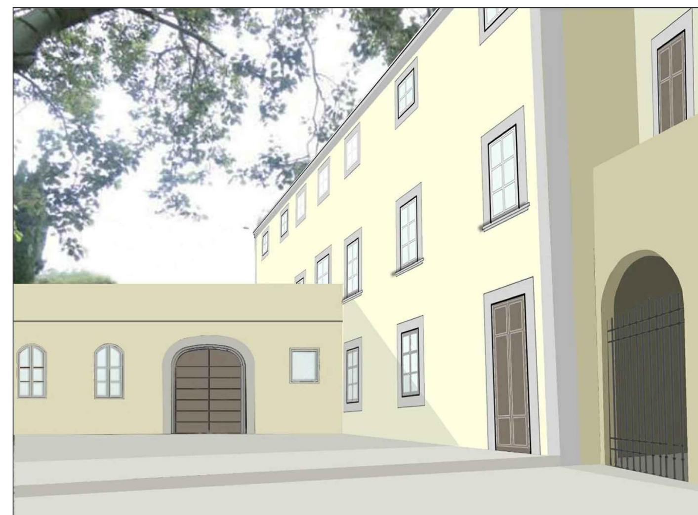
SIMULAZIONE DI PROGETTO