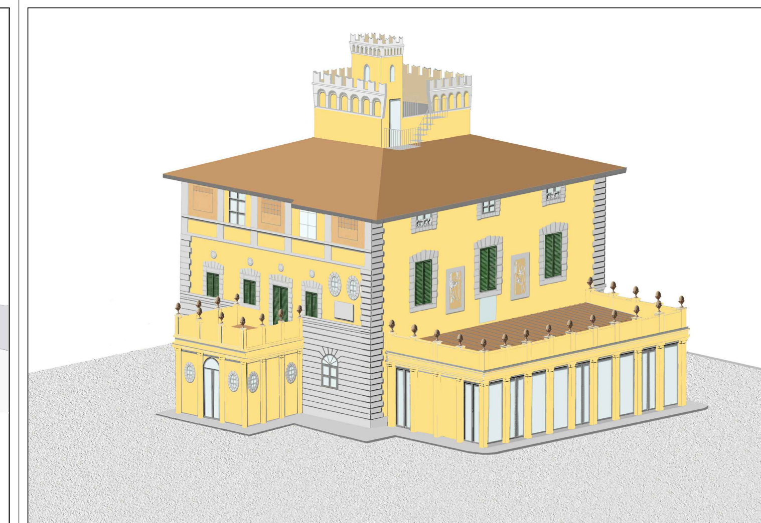
ASSONOMETRIA STATO DI PROGETTO