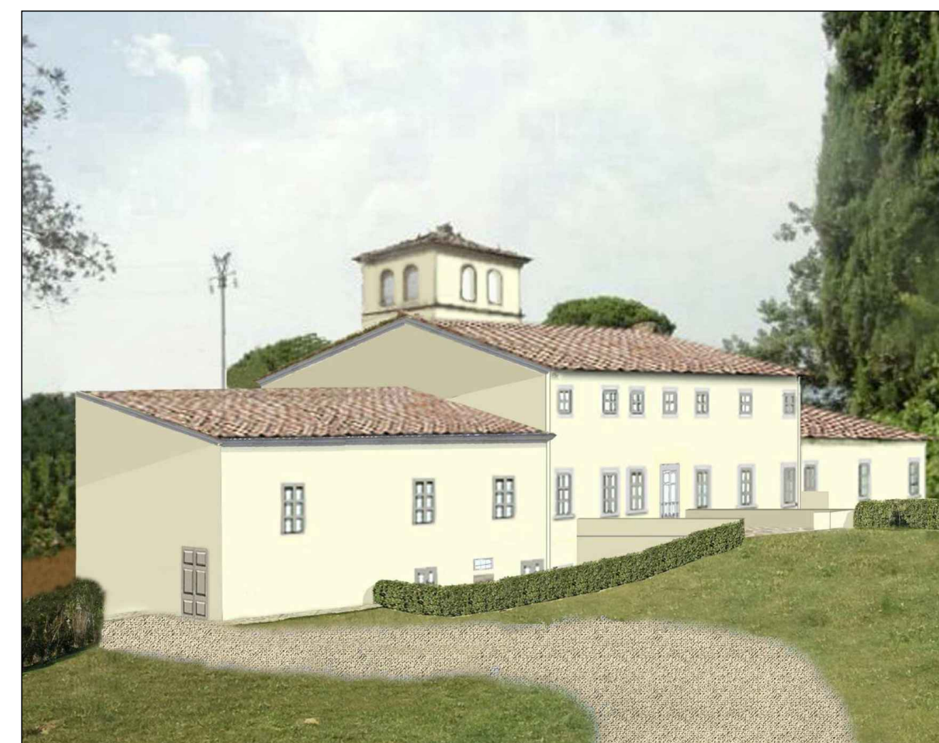
SIMULAZIONE DI PROGETTO